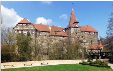
Lauf Wenzelschloss

Dem schnellen "Loufen" der Pegnitz mit ihren Stromschnellen verdanken die "Laffer" ihren Namen. Schon im Mittelalter trieb der Fluss zahlreiche Mühlen und Hämmer an. Zur Sicherung des Handelsweges von Nürnberg nach Prag wurde auf einer Pegnitzinsel ein Wasserschloss errichtet, Karl IV hielt sich des öfteren im Wenzelschloss auf. Der fast rechteckige Marktplatz wird von stattlichen Fachwerk- und Sandsteingiebelhäusern gerahmt, unter denen sich ausgedehnte Kelleranlagen befinden. Die aus heimischem Keupersandstein erbaute Johanniskirche überrascht mit einer barocken Ausstattung. Einer der ersten bayerischen Kindergärten wurde in Lauf eröffnet, daneben liegt die imposante Ruine der ehemaligen Pfarrkirche St. Leonhard, die im 2. Markgrafenkrieg zerstört wurde. Das Hersbrucker und das Nürnberger Tor bilden die Eckpunkte der Laufer Altstadt.